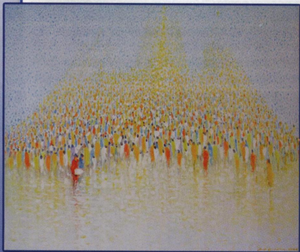
Stradă în Bruxelles